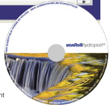
Le cédérom actuel contenant le logiciel gratuit